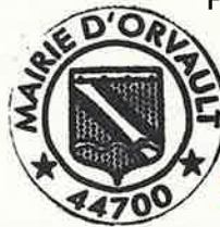
Sébastien ARROUËT, Maire d'Orvault

Rendu exécutoire, par dépôt en préfecture le : 15 AVR. 2026