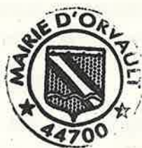
Sébastien ARROUËT Maire d'Orvault

Rendu exécutoire par dépôt en préfecture le : 26 MARS 2026