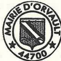
Sébastien ARROUËT Maire d'Orvault

Rendu exécutoire par dépôt en préfecture le : 26 MARS 2026