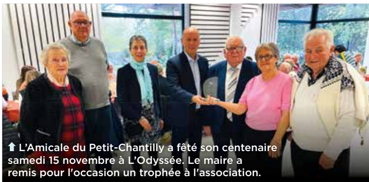
↑ L'Amicale du Petit-Chantilly a fêté son centenaire samedi 15 novembre à L'Odyssee. Le maire a remis pour l'occasion un trophée à l'association.