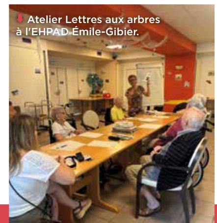
↓ Atelier Lettres aux arbres à l'EHPAD Émile-Gibier.

Le centre socioculturel de la Bugallière peut compter sur la disponibilité et l'engagement des aînés. Non seulement de nombreuses activités leur sont proposées, entre gym douce et adaptée, sorties culturelles, balades en triporteur ou réveillon préparé par des jeunes, mais certaines sont elles-mêmes animées par des retraités. C'est le cas par exemple des ateliers numériques et cuisine ou du soutien scolaire. Les seniors sont aussi très présents pour animer le bar associatif Bugabar et le café convivial du jeudi, preuve que le vieillissement représente un vaste défi mais aussi une immense opportunité.