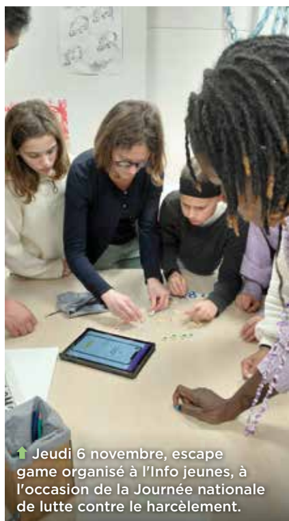
↑ Jeudi 6 novembre, escape game organisé à l'Info jeunes, à l'occasion de la Journée nationale de lutte contre le harcèlement.

Chaque année, le projet éducatif et citoyen municipal porte un enjeu particulier vers la jeunesse orvaltaise, à travers des ateliers, rencontres, temps d'information... En 2025-2026, il s'agira de s'interroger sur la manière de faire vivre cette notion de citoyenneté au quotidien : prendre soin de soi et des autres, respecter l'autre et ses différences, s'engager, dans la vie de son école ou à l'échelle de sa commune, à la maison, en famille, à l'école, entre amis ou dans la rue... Des jeux familiaux favorisant l'inter-connaissance ont été proposés dans les écoles en novembre. Un escape game au Petit-Chantilly a permis de parler de laïcité début décembre et d'autres rendez-vous sont prévus ces prochaines semaines :