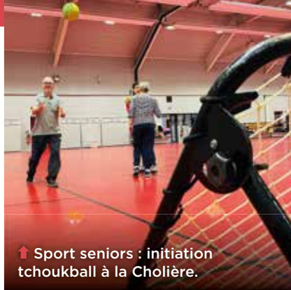
↑ Sport seniors : initiation tchoukball à la Cholière.

fixe un cadre pour valoriser le potentiel des seniors et mieux adapter les villes à leurs besoins. En 2024, la municipalité s'est engagée dans cette démarche. 650 personnes ont contribué à un diagnostic durant le premier semestre 2025 qui a inspiré un plan d'action : + d'infos sur orvault.fr