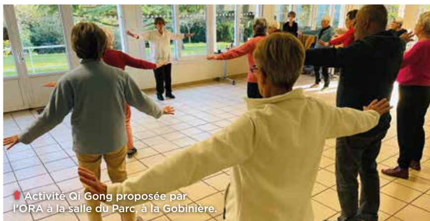
Activité Qi Gong proposée par l'ORA à la salle du Parc, à la Gobinière.

Les structures associatives se sont en effet parfaitement adaptées aux besoins réels des seniors. Orvault Retraite Active (ORA) propose ainsi 26 activités (hors sorties et après-midi dansants) à ses 800 membres, de 55 à 105 ans. Elle innove sans cesse : section échecs, session code de la route, dictée du mois... Le Qi Gong séduit particulièrement. Dans