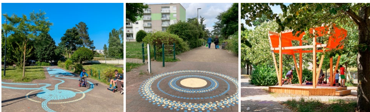
Deux nouveaux aménagements réalisés en chantiers participatifs et testés : les fresques de l'artiste nantais FZE Sethi et le Refuge.

Le projet global s'attache aussi à lutter contre la précarité et favoriser le bien-vivre ensemble. À ce titre, le Territoire de Réussite Éducative , piloté par la Ville, accompagne les enfants les plus en difficulté. La médiation animale proposée sur le quartier rencontre aussi un vif succès. Les initiatives habitantes ne sont pas en reste pour mieux vivre ensemble : les jeunes kapseuses et kapseurs installés au Lay depuis un an font partie de ces bénévoles actifs dans le quartier.