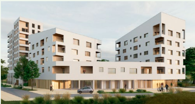
La future résidence autonomie et l'immeuble du Chêne Rouge en arrière plan