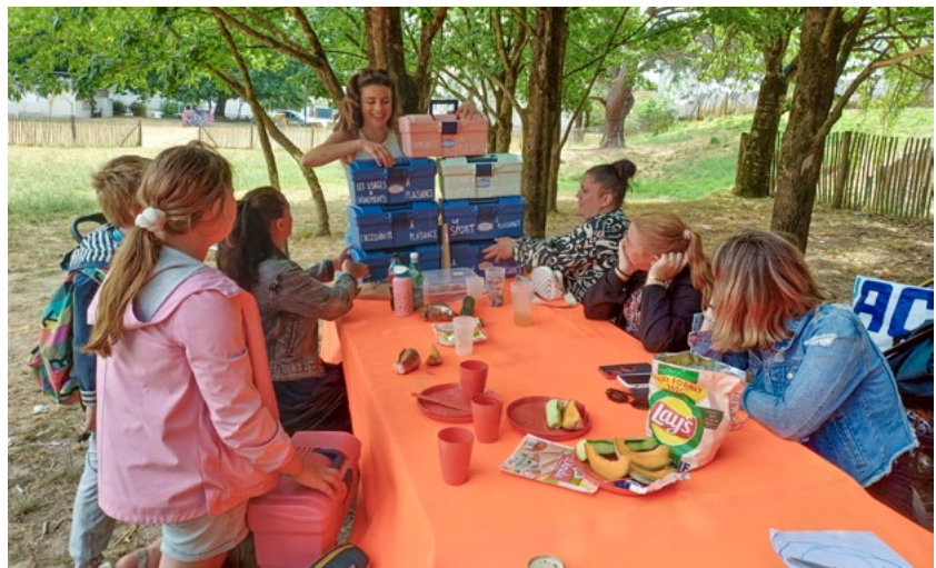
Les ambadrices et des habitantes pendant des ateliers de la Bande Plaisante au parc de Plaisance.