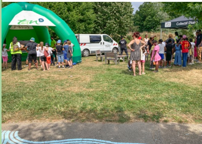
25/06 Fête de l'innovation HLM