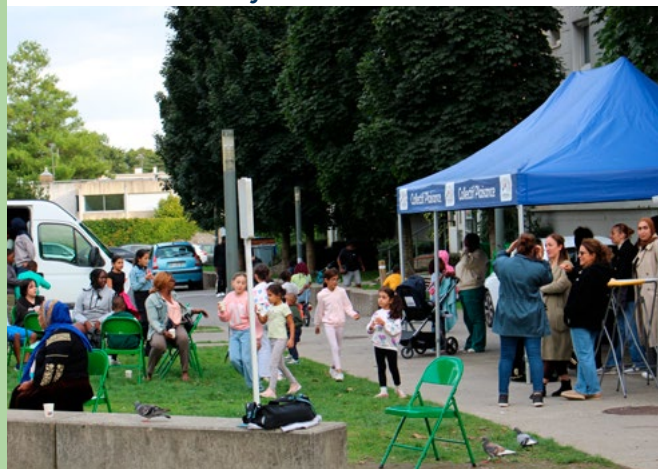
12/09 Fête du Lay