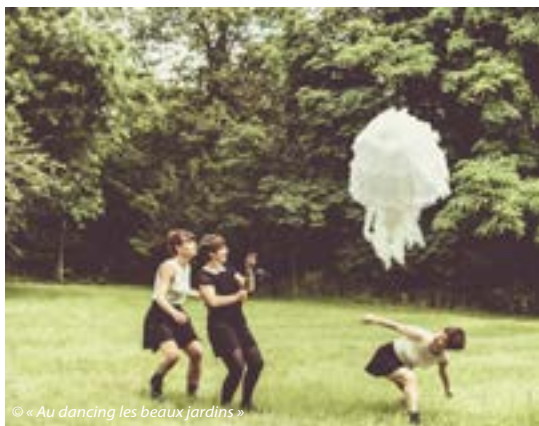
© « Au dancing les beaux jardins »

Mercredi 22 mai, à 15h30 - Parc de Plaisance En famille à partir de 2 ans - Durée 40 min, sans réservation