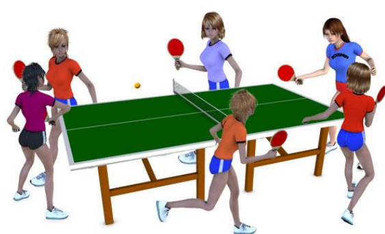
Tennis de table