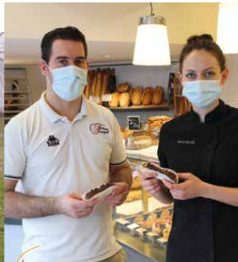
Le meilleur éclair au chocolat P.9