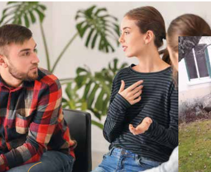
Un tremplin vers l'emploi P.5