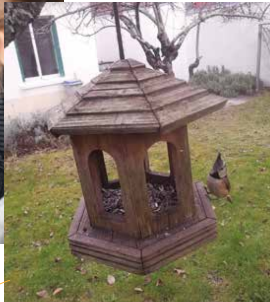
Quartiers libres pour la nature P.8