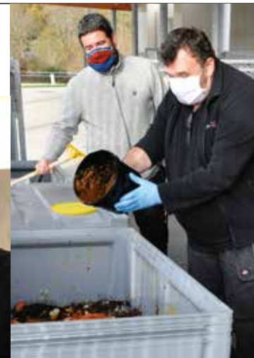
Le pré-compostage en test au Vieux-Chêne P.10