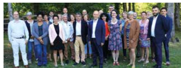
Les 25 membres de la majorité municipale.

Nous vous souhaitons une très belle année 2021. Elle sera d'autant plus belle que nous continuerons ensemble à être attentifs les uns aux autres.